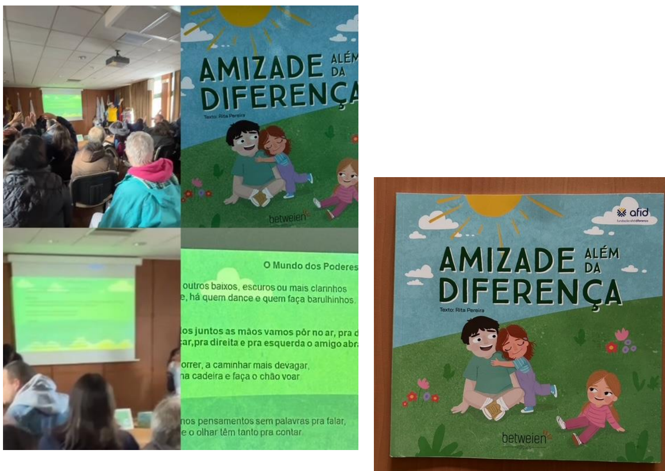
Livro à venda na secretaria da Fundação Afid Diferença