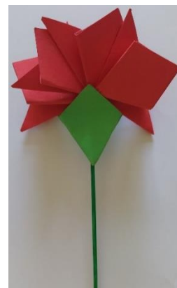
Cravo – realizado pelos formandos da Formação Profissional