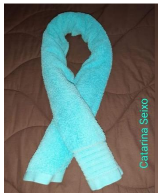
Fotos: Grupo de Inclusão – Laços Azuis feito pelos clientes de CACI